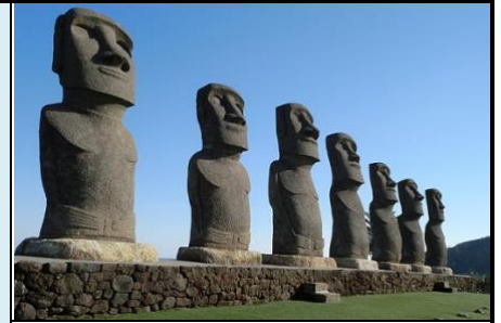
日南太陽花園- 摩艾石像