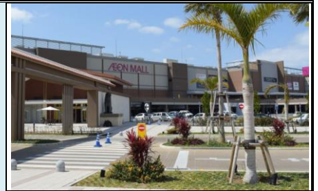
永旺夢樂城沖繩來客夢