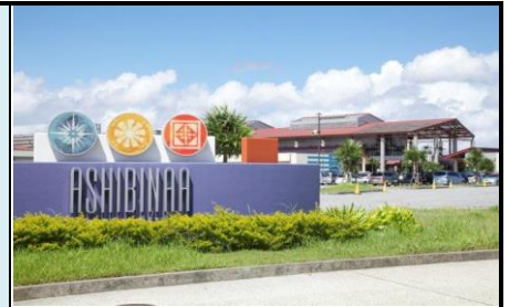
Ashibinaa Outlet Mall